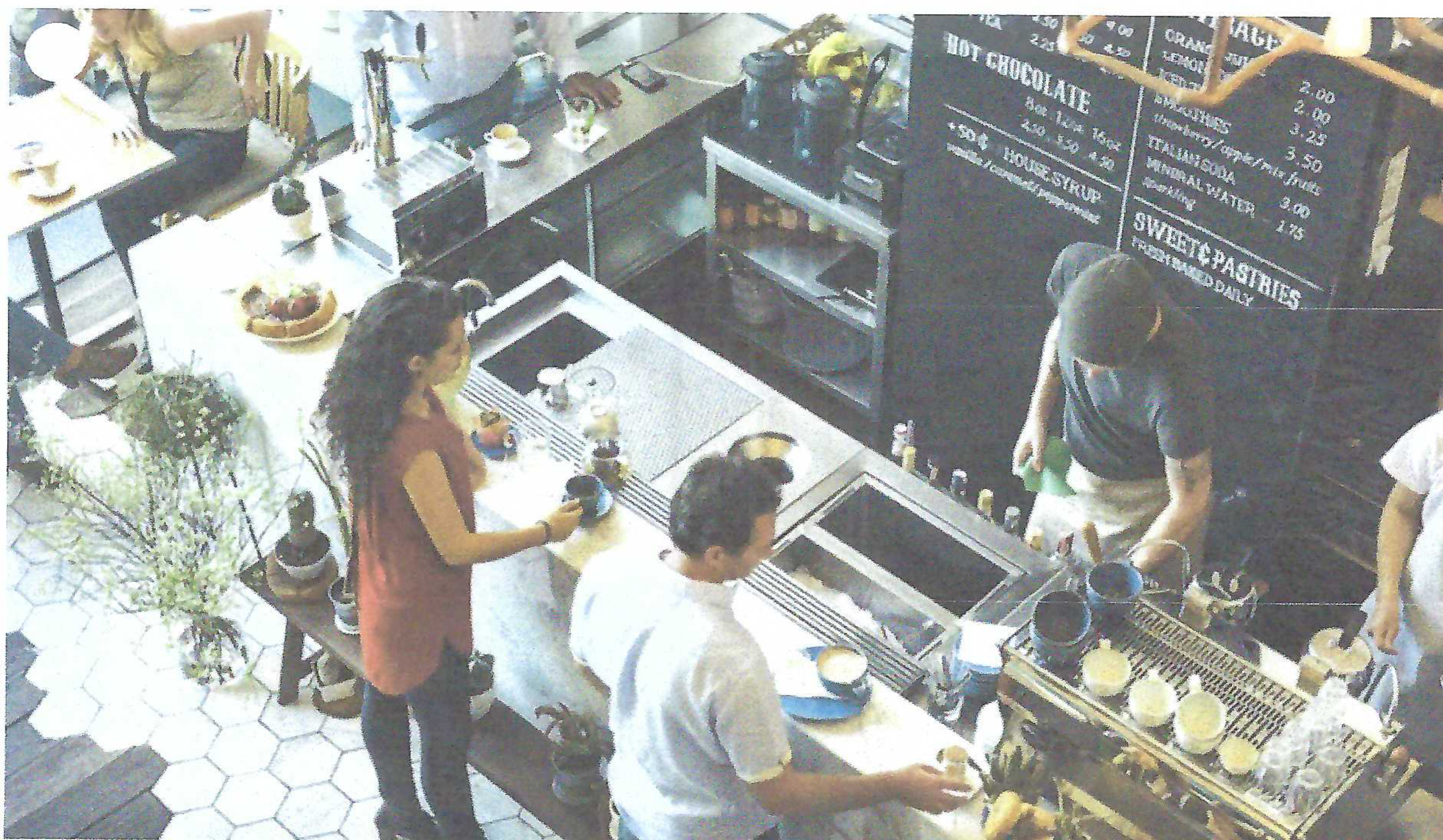
רישוי עסקים ומפעלי מזון: מה חשוב לדעת לפני שמוציאים רישיון עסק?