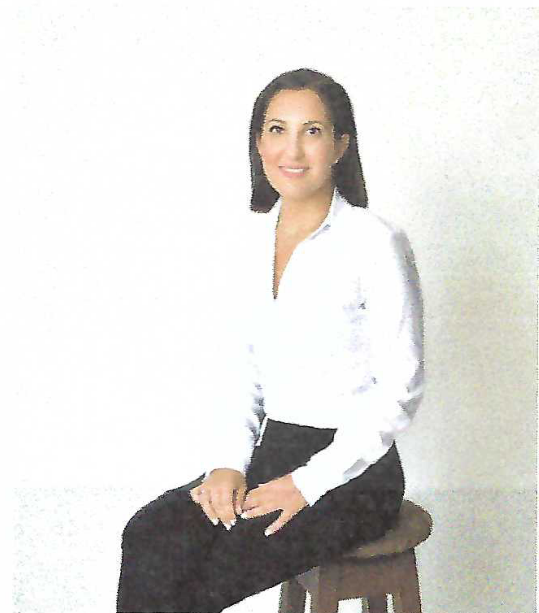
"ככל ששיתוף הפעולה והתקשורת בינינו טובים יותר, כך התהליך כולו מתנהל בצורה אפקטיבית יותר" איפור: חני שרף-ימיני ל'פרסי'

לאחר מכן מתחיל שלב התכנון שבו נלקחים בחשבון הצרכים התכנוניים והתפעוליים מחד ודרישות הרשויות מאידך, זאת בשילוב פתרונות יצירתיים וחשיבה 'מחוץ לקופסה', שתכליתם להגיע אל היעד בדרך המהירה והנכונה.